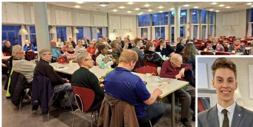
Korson poliitikoilla maaliskuun 2026 yleiskuva

Ilaisia uutisia Korsoon olivat Mikkolan hiekalle rakennettava tekonurmikenttä jalkapalloilijoille, Kulomäen kentän leikkipuiston uusiminen sekä yhteisöllisen Ristirajapuiston rakentaminen erityisesti ikäihmisille soveltuvaksi. Korson keskustan tyhjälle hiekkakentälle on tulossa kesäksi väliaikainen kaupungin tapahtumakontti, minkä